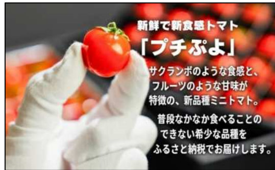
(ふるさと納税掲載サイト)